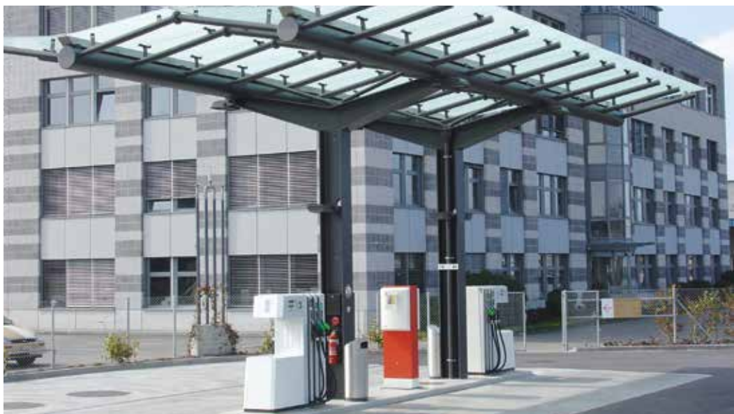
Grossrietstrasse 7, 8606 Nänikon