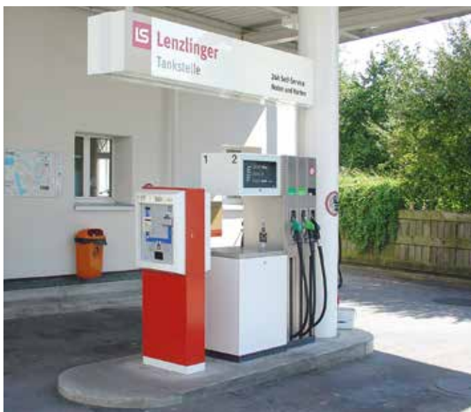
Sonnenbergstrasse 11, 8610 Uster

Mit dem Bewusstsein, dass fossile Treibstoffe umweltkritische Produkte sind und der Betrieb von Tankstellen ein verantwortungsvolles Handeln in Bezug auf die Umwelt und Qualität bedingt, sind unsere Tankstellen alle mit einer flüssigkeitsdichten Fahrbahn und einem Gasrückführungssystemen ausgestattet. Und sollte dennoch einmal ein Missgeschick passieren, steht unser Pikett-Team rund um die Uhr zur Verfügung.