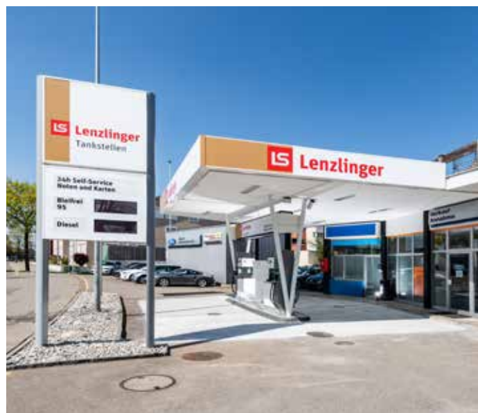
Hochstrasse 157, 8330 Pfäffikon ZH